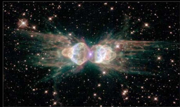
Planetary Nebula Mz 3